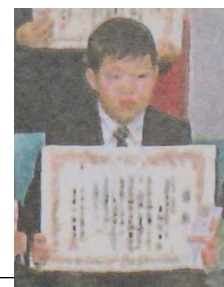
表彰式の写真